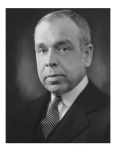
J. Gresham Machen