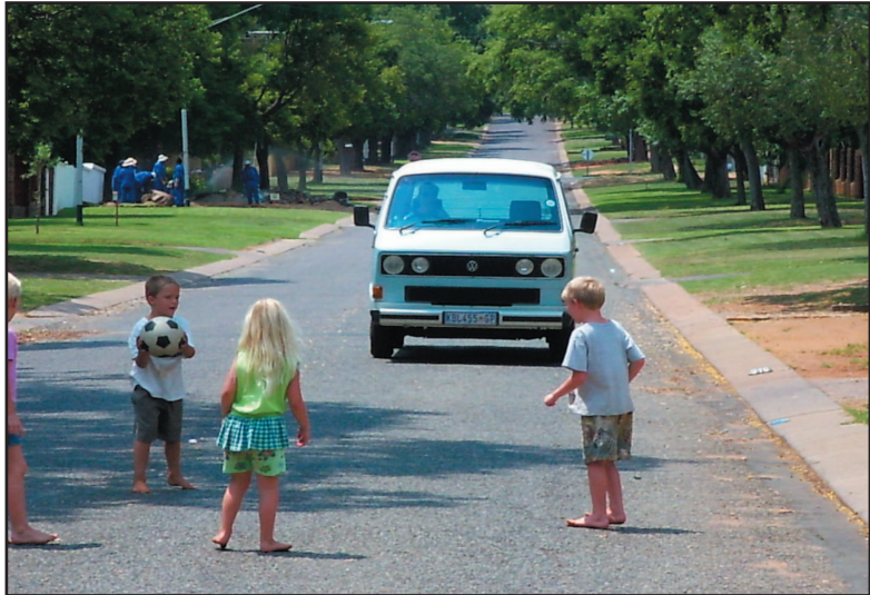
Dit is gevaarlik om in die straat te speel

Sypaadjies is daar vir die voetgangers se gerief en veiligheid. 'n Voetganger moet steeds veiligheidsbewus optree al is hy of sy op 'n sypaadjie. Dit is gevaarlik om te naby aan die rand van die pad op 'n sypaadjie te loop. Net so gevaarlik is dit om op die randsteen te sit, met jou voete in die straat. Onthou, 'n ongeluk gebeur in 'n oogwink.