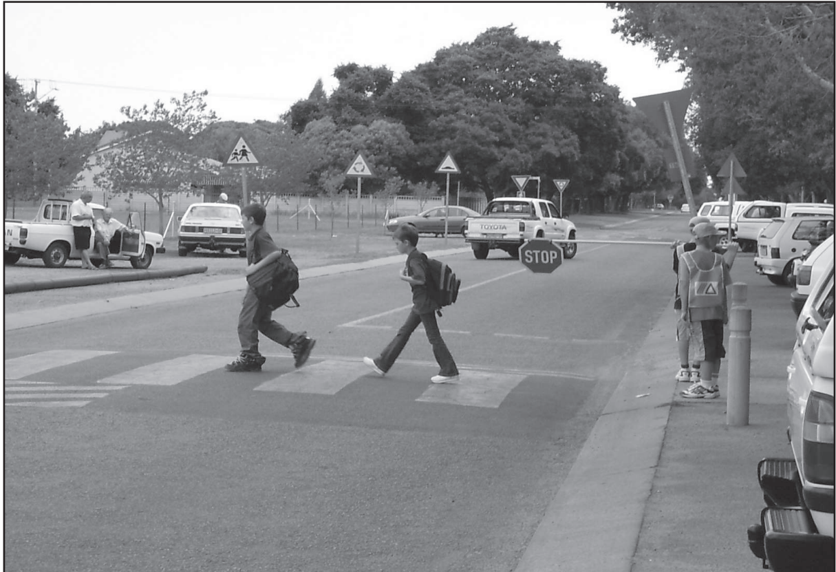
Padpatrollie verseker die veiligheid van skoliere

Wees baie versigtig as jy by 'n stilstaande voertuig die pad wil oorsteek. Loop stadig totdat jy weerskante van die straat mooi kan sien. Onthou, motoriste kan jou nie agter 'n motor raaksien nie. Dit geld byvoorbeeld as jou ouers op 'n plek stop en jy gou die straat moet oorsteek om iets by 'n winkel te gaan koop.