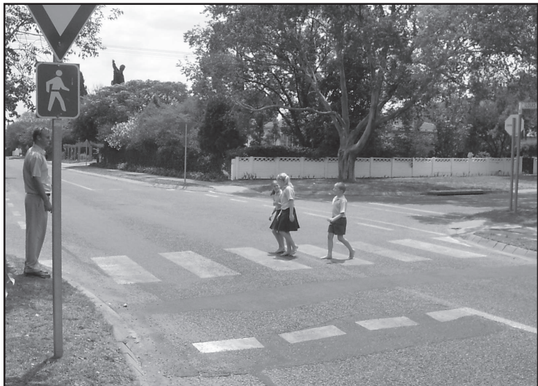
Strate moet op veilige punte oorgesteek word

Die punt waar die meeste ongelukke voorkom, is by die oorsteek van strate. Dis baie maklik om jou met die spoed van 'n aankomende voertuig te misgis en so tot 'n ongeluk aanleiding te gee. Om ongelukke te vermy, moet die volgende gedoen word: Kyk altyd eers regs, dan links en dan weer regs in die pad af om seker te maak dat dit veilig is om oor te stap. Moenie oorstep voor die pad skoon is of die voertuie gestop het nie.